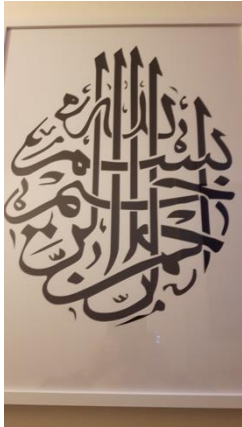
Bismi'llah (50x70 cm) 45,-

phrase Bismillah in an 18th-century Islamic calligraphy from the Ottoman region and called Thuluth (zoomorphic calligraphy)