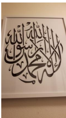
Shahada (50x70 cm)45,-

De stam van het eerste woord van de soera 96 van de , iqra (reciteer), heeft dezelfde wortel als quran (koran), die gereciteerd moet worden ( de soera werd aan Mohammed geopenbaard door God via de engel Gabriel . ( Calligraphy Thuluth mirror style )