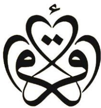
Iqra (50x50 cm)35,-

Bismi'llah ir-Rahman ir-Rahiem -De twee meest gebruikte vertalingen in het Nederlands zijn: "In de naam van God, de Erbarmer, de Meest Barmhartige" en "In naam van God, de Barmhartige, de Genadevolle" Rahman en Rahiem zijn de eerste twee namen van de 99 Schone Namen van God. The phrase Bismillah in an 18th-century Islamic calligraphy from the Ottoman region and called Thuluth